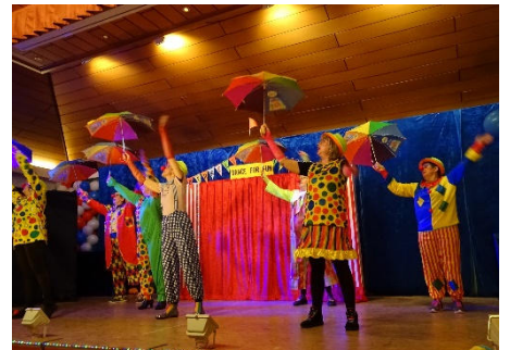
Für Stimmung sorgt der Zirkustanz der Gruppe "Dance for fun".