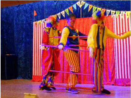
Die Clownparade zieht durchs Publikum und zaubert allen ein Lachen ins Gesicht.