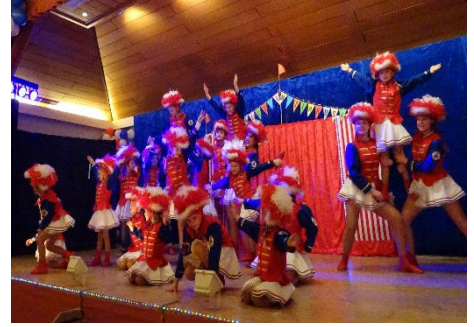
Für einen flotten Auftakt sorgten nach Kaffee und Kuchen die Minis der KG Narrenzunft Kempfen. Tänze der Schüler und Jugend folgten.