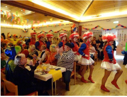
Einzug der Narrenzunft Kempfen im fröhlich geschmückten Festsaal.