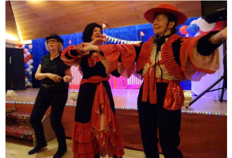
Unter dem Motto „Wunderwelt im Zirkuszelt“ animiert die Gruppe zum schunkeln und lachen.