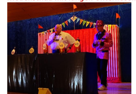
Sketch: Die drei Flaschengeister