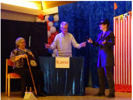
Die SI-Theatergruppe spielt den Sketch „Banküberfall“