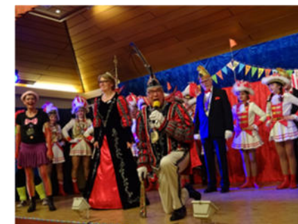
Das Prinzenpaar in der SI