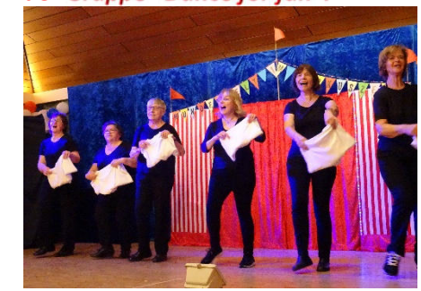
Modenschau mit langen Unterhosen